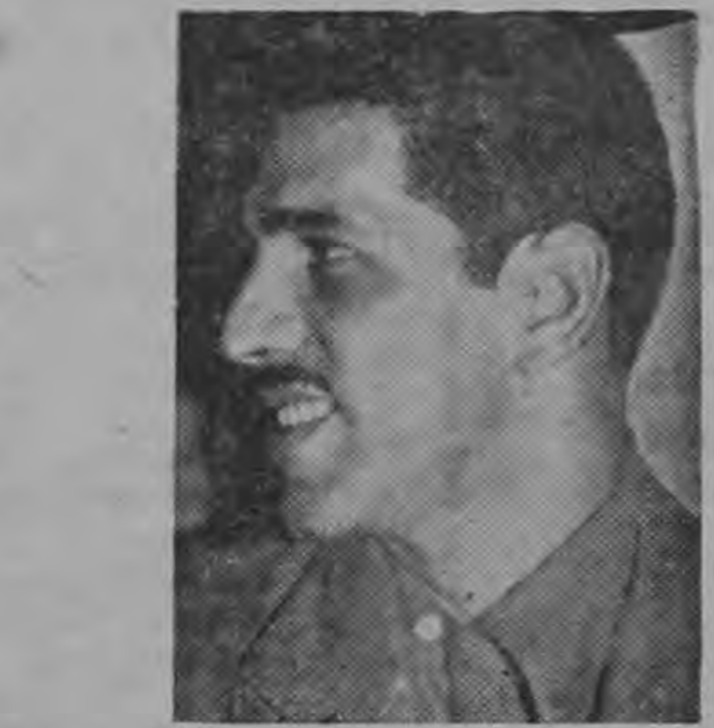
tracurrículo, si estaría completando un programa deficiente.

Es un hecho probado que los mismos argumentos emitidos y aceptados por la Facultad cuando se eliminó el Examen de Incorporación para los actuales estudiantes, tengan el mismo peso para los egresados que ahora luchan por su incorporación. La derogación no se debió a que con un nuevo programa de estudios, supuestamente más completo, el examen de incorporación saliera sobrando. Esto, bajo cualquier punto de vista es desechable. La repetición de un examen no sustituye en ninguna forma un programa deficiente, puesto que se va a re-examinar sobre conocimientos ya adquiridos y aprobados. Si el examen de incorporación se realizara sobre un trabajo ex-