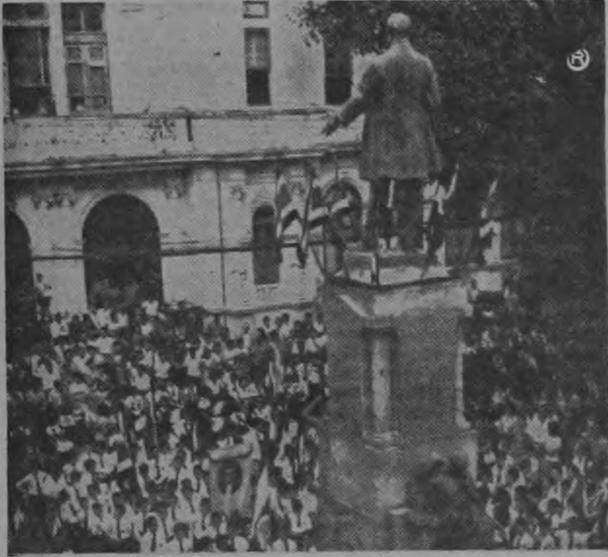
NUMEROSO PUBLICO formó círculo alrededor de los escolares que ayer en la mañana se situaron frente a la estatua de Juan Rafael Mora, para conmemorar su fallecimiento, que se produjo en Puntarenas el 30 de setiembre de 1860, en compañía del General Cañas.