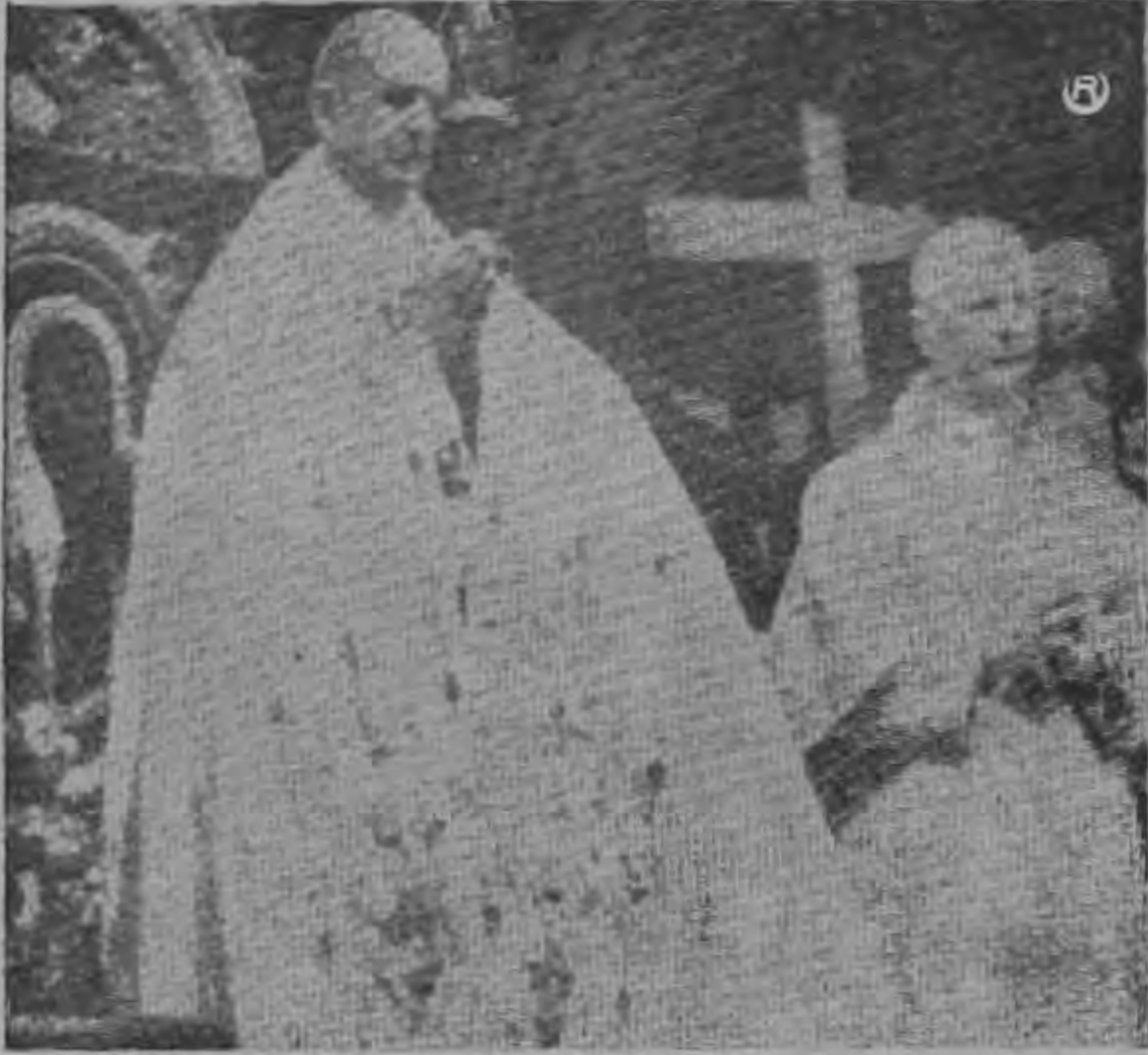
EL PAPA PAULO VI, en momentos en que abría la Segunda Sesión del Concilio Ecuménico en Roma, donde se completarán las discusiones sobre importantes temas de la Iglesia y el mundo actual.

ARGEL, 30 (AP) —El Presidente Ahmed Ben Bella dijo esta noche que tropas marroquises se concentran cerca de la frontera argelina en un intento de respaldar la rebelión Berebere en Cabilia contra el gobierno argelino.