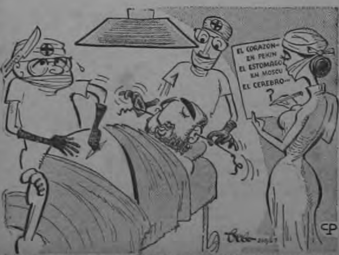
"SU CORAZON ESTA EN PEKIN - SU ESTOMAGO EN MOSCU."

Las solicitudes para ofrecer un hogar a un estudiante norteamericano de secundaria, para que conviva con la familia y participe de su vida durante un año lectivo a la vez que asiste a un colegio de secundaria, deben ser hechas por familias que tengan en su seno un adolescente de la misma edad y sexo del que se desea traer, y deben ser enviadas al Comité Costarricense del American Field Service al Apartado 4507, San José, lo más pronto posible ya que las mismas tienen que ser remitidas a New York, el próximo mes de Octubre. Los becados norteamericanos vendrán a Costa Rica en Febrero del 64 para comenzar a asistir al curso lectivo regular que se inicia en marzo.