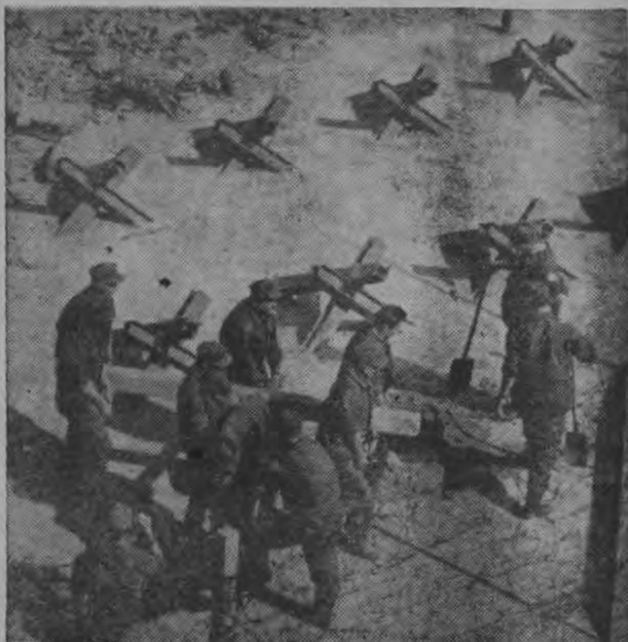
A PESAR DEL ACERCAMIENTO ORIENTE OCCIDENTE, LA ALEMANIA ORIENTAL REFUERZA EL MURO DE BERLIN. Los miembros de la milicia comunista del Berlín oriental pasan los sábados por la tarde reforzando el muro edificado por los comunistas que divide los dos Berlines. En la foto, unos milicianos levantan nuevos obstáculos para detener a los que tratan de huir, cerca del puesto de paso de la Heinrich-Heine Strasse.