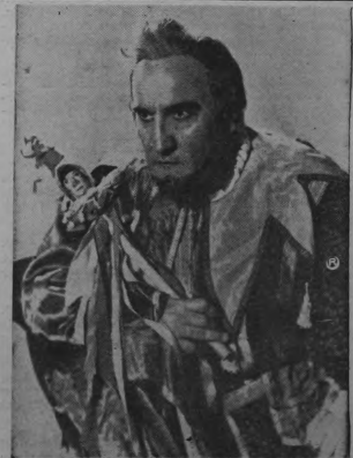
El gran baritono Otello Bersellini protagonizará el conocido personaje de la ópera de Verdi, Rigoletto, en cuyo rol tantos aplausos ha cosechado el gran cantante. A teatro lleno se representará Rigoletto, en la despedida de la Compañía de Opera Italiana al público costarricense. Esta noche, a las 8 en el Teatro Nacional.

Tesorero Antonio Escarré Cruz. El Directorio electo funcionará hasta setiembre del próximo año, y se propone reunirse por lo menos dos veces por semana para cambiar impresiones, coordinar su acción en la Corporación y formular un plan de trabajo.